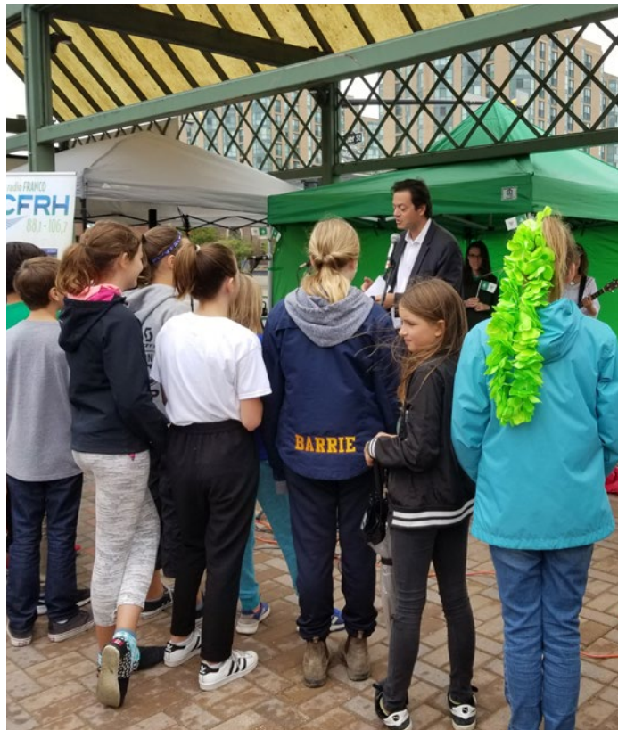
L'Entité 4 participe au lever du drapeau franco-ontarien à Barrie.

Les ateliers sur l'offre active aident l'Entité 4 à tisser des liens étroits avec les fournisseurs de services de santé de son territoire et à soutenir des collaborations avantageuses qui suscitent une amélioration des services en français. De plus, l'Entité 4 partage son expertise sur les meilleures pratiques et les politiques à adopter lorsqu'il s'agit d'identification linguistique des patients. L'Entité 4 a également diffusé des lignes directrices qui aident les fournisseurs à amorcer le processus d'identification des patients.