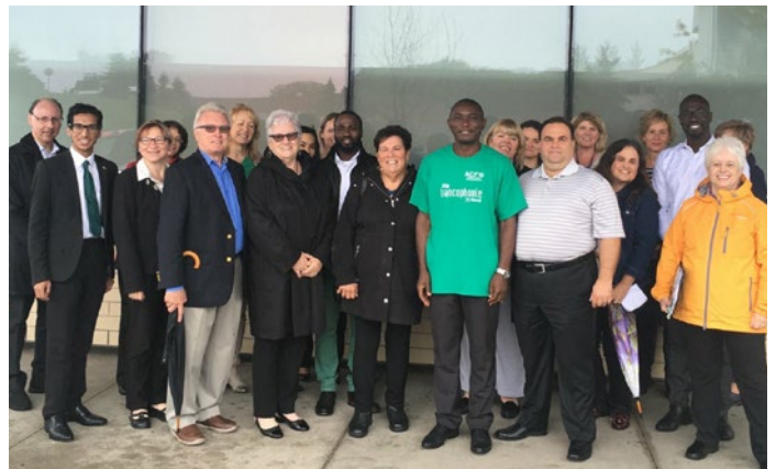
Participants et participantes au lever du drapeau franco-ontarien à Durham.