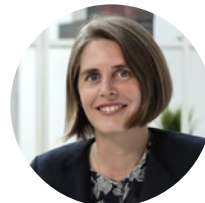
La directrice générale,