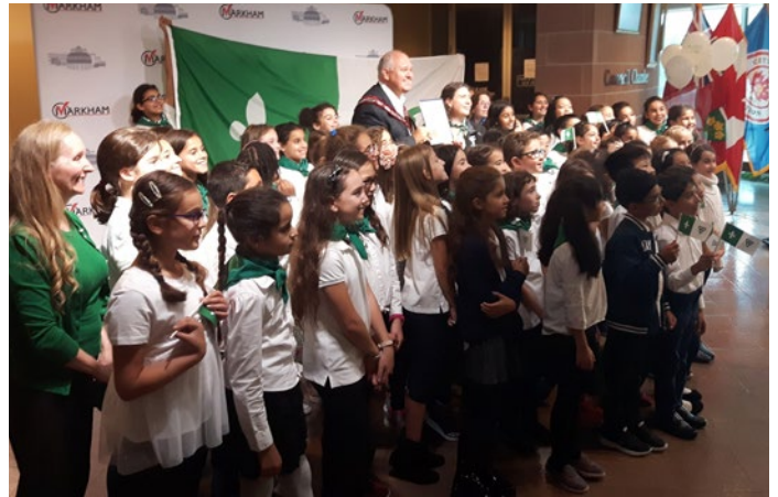
Le maire de Markham, Frank Scarpitti, participe au premier lever du drapeau franco-ontarien en compagnie d'élèves francophones à la suite de l'obtention de la désignation de la Ville de Markham, le 1 er juillet 2018.

En février 2017, le gouvernement provincial a annoncé l'octroi de financement pour les services de psychothérapie à l'intention de personnes atteintes de troubles tels l'anxiété et la dépression. L'Entité 4 a travaillé avec le Centre des sciences de la santé mentale Ontario Shores et le Centre de soins de santé mentale Waypoint pour combler les lacunes dans les services de santé mentale et de toxicomanie offerts aux francophones et pour rendre ces services plus accessibles. Ce programme encadre l'affectation de spécialistes cliniques en santé mentale dans le secteur des soins primaires ainsi qu'en milieu communautaire. Depuis l'automne 2018, du personnel clinique qui parle le français est en poste à Toronto North Support Services et au CSC TAIBU (RLISS du Centre et du Centre-Est), ainsi qu'à l' Association canadienne pour la santé mentale du comté de Simcoe et au CSC CHIGAMIK (RLISS de Simcoe Nord Muskoka).